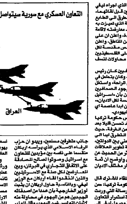
مركز غراوت (مبارك)